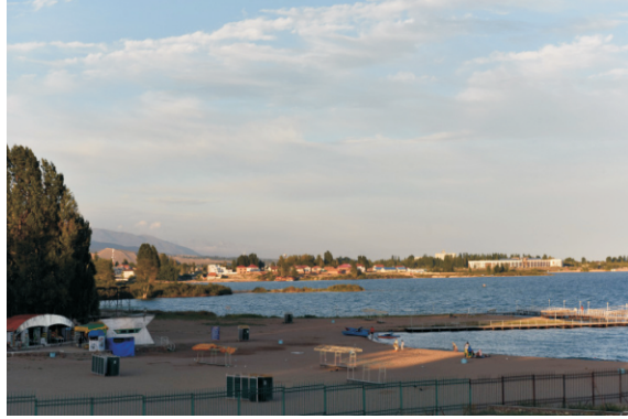
Issık Göl (2016)

Sovyetler Birliği döneminde Issık Gölü etrafındaki birçok sanatoryum, pansiyon ve tatil evleriyle çekici bir tatil merkezi haline gelmişti. Sovyetler Birliği'nin dağılmasının ardından bu işletmeler zor dönemler geçirdi. Bugün bu bölgedeki büyük oteller kapatılmakta, yerlerine yeni nesle hitap eden yatak ve kahvaltılı pansiyonlar açılmaktadır.