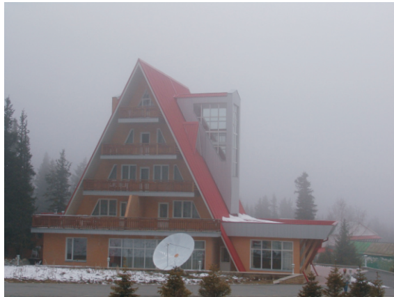
Ala-Arça Millî Parkı, Otel (2006)

2006 yılında toplantıdan arta kalan zamanımızda arkadaşlarımızla Ala-Arça Millî Parkını görmeye gittik. Baharın ilk