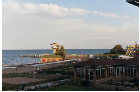
Issık Göl (2016)

Issık Gölünde özel balık türleri yaşar. Çebak (Leuciscus schmidt), Marinka (Schizothorax issyk-kuli), Şir veya yalın Osman (Diptychus dybovskii), Leuciscus bergi, Phoxinus issykkulensis, Noemacheilus strauchii, Abramis brama, Coregonus avaretus, Salmo ischchan, Stizostedion lucioperca, Cyprinus carpio