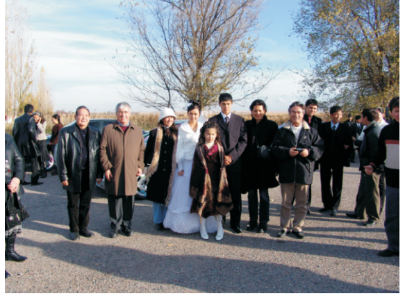
Yeni evliler (2006)

Balasagun ören yerini gezdiğimiz sırada, yeni evlenen bir çiftin ören yerine geldiğine tanık olduk. Yeni evliler, ören yerine dua etmek ve hatıra fotoğrafı çektirmek için gelmişler. Biz de onlarla birlikte fotoğraf çektirdik.