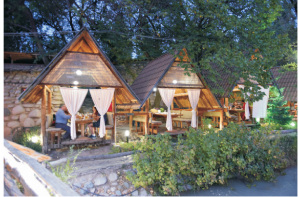
Supara Etnik Köyü (2016)

Yemek öncesi Supara Etnik köyünü gezmek ve Kırgız kültürüne ilişkin nesnelere görmek oldukça etkileyici. Rehber sizi bilgilendiriyor. Biz de yemek öncesi öyle yaptık.