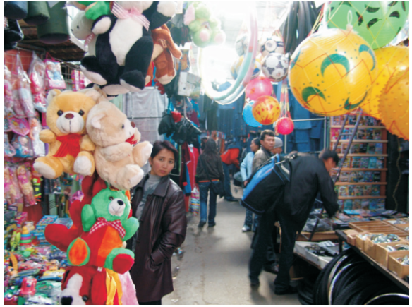
Dordoy arşısı (2006)

Dordoy arşısı, Bişkek metropol alanı ve tüm uy Nehri Vadisi bölgesi için önemli bir alışveriş ve istihdam merkezidir. Ayrıca in'den gelen tüketim mallarının Kazakistan, Rusya ve Özbekistan'daki dükkanlara ve pazarlara ulaşmasında önemli bir rol oynayan ana ticaret merkezlerinden biridir. Bazı ekonomistlere göre, bu yeniden ihracat (Özbekistan'ı hedefleyen diğer merkez ise Oş Bölgesi, Kara-Suu'daki Karasu arşısı'dır) Kırgızistan'ın en büyük iki ekonomik faaliyetinden biridir.