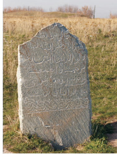
İslamiyet sonrası mezar taşı (2006)

İslamiyet'in Orta Asya'da kabul edilmesi ve yayılmasıyla birlikte Arap harfli yazıtlar görülmeye başlamıştır. Öncelikle bölgeye gelip şehit düşenlere ilişkin mezar taşlarında kullanılan Arap alfabesi, daha sonra dinî ve sosyal hayatın her alanında kullanılmıştır