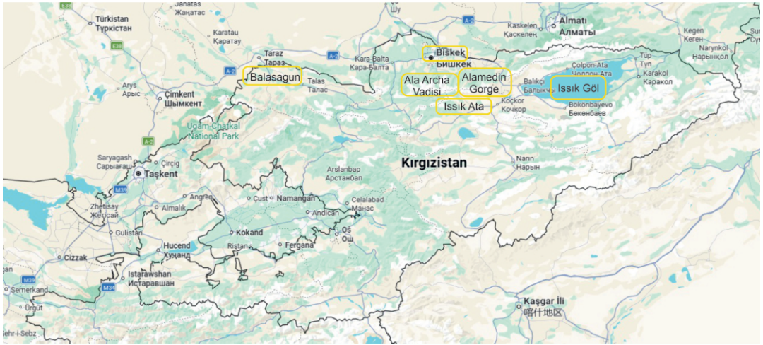
Kırgızistan'da gezip gördüğüm yerler

Bu kitapta gördüğüm yerleri tanıtacağım ve anılarımı ekleyeceğim.