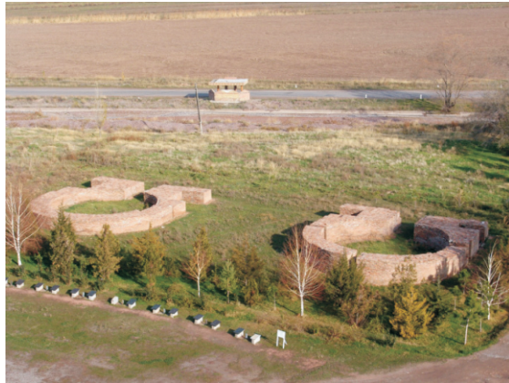
Balasagun, Türbeler (2006)

Karahanlı Devleti'nin başkentinde başta hanedan mensupları olmak üzere bilginler için türbeler yapılmıştır. 1970'lerin başında Kırgızistan Bilimler Akademisi Tarih Enstitüsü Arkeoloji Bölümü'nün çalışmaları sonucunda ortaya çıkarılan üç türbe 1970-1974 yılları arasında temel seviyesinde tamir ettirilmiştir. Türbe içinde birden çok hanedan mensubunun mezarları bulunmaktadır. Türbeler genel olarak X-XII. yüzyıla tarihlendirilebilir.