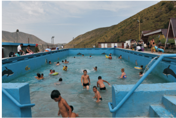
Issık Ata (2016)

Issyk-Ata, 1891'den kalma tarihi Issyk-Ata Sanatoryumu'na ev sahipliği yapan ve Orta Asya'nın en eskilerinden biri olan iyi bilinen bir tatil beldesidir. Kurulmasından çok önce, yerel halk kaplıcaları ziyaret ediyordu ve II. Dünya Savaşı sırasında sanatoryum, hızlı iyileşme sonuçlarıyla bilinen yaralı askerler için bir iyileşme merkezi haline geldi. Buradaki temel tedavi kaynağı, yıl boyunca sabit +54°C sıcaklıkta olan mineral sudur ve bir çamur terapi kliniğiyle tamamlanmaktadır.