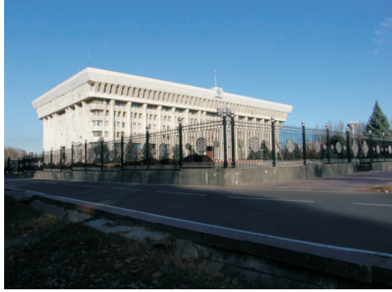
Kırgızistan Meclis Binası (2006)

Bişkek, Tanrı Dağlarının bir uzantısı olan Kırgız Ala-Too Sıradağları'nın kuzey ucunda, yaklaşık 800 m rakımda yer almaktadır. Bu dağlar 4.895 m yüksekliğe ulaşmaktadır. Kentin kuzeyinde, verimli ve hafifçe dalgalanan bir bozkır, komşu Kazakistan'a kadar uzanır. Bölgenin büyük bir kısmı Çu Nehri tarafından sulanır. Bişkek, bir yan hat ile Türkistan-Sibirya Demiryolu'na bağlıdır.