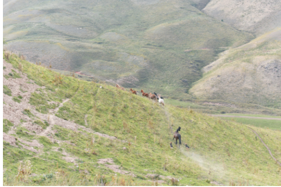
Alamedin Gorge Yaylası

biridir. Başkentten geçen Alamedin Nehri de bu geçitten geçer. En kolay erişim noktası Koi-Tash köyüdür ve burayı hem yerliler hem de ziyaretçiler için popüler bir yer haline getirir. Deniz seviyesinden 1,800 ila 2,000 m yükseklikte bulunan geçit, nefes kesen şelaleler, yemyeşil ağaç ve çalı koruları ve ünlü Aitmatov ve Kırgızistan Zirveleri de dahil olmak üzere görkemli dağ zirvelerinin manzaralarını sunmaktadır. Geçit, yüzlerce hayvan ve kuş türünün evi olarak adlandırıldığı çeşitli yaban hayatına ev sahipliği yapmaktadır. Yaz aylarında, yeşil çayırlar, yerel çobanlar tarafından bakılan at ve koyun sürüleriyle canlanırken, bölge ayrıca şifalı özellikleri için sıklıkla hasat edilen ve bitki çayları yapmak için kullanılan tıbbi bitkilerle de zengindir.