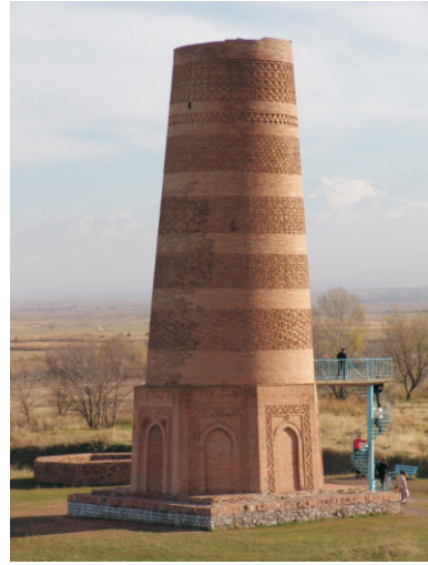
Burana (Cuma Camisi) Minaresi (2006)

Sekizgen kaidenin her yüzünde tuğla örgülü sağır sivri kemerli nişler vardır. Nişlerin etrafı üç yönden bordür ile çevrilidir. Nişlerin içinde, etrafındaki bordürlerde, silindirik gövdede yer alan kuşaklarda genel olarak; çarkifelek, dikey, yatay ve çapraz şekilli geometrik bezemelerden oluşan süslemeler bulunmaktadır. Aşağıdan yukarıya doğru daralan silindirik gövdenin günümüze ulaşan kısmı 11 farklı bezeme kuşağına bölünerek tuğla malzemenin çeşitli şekillerde istiflenmesiyle süslenmiştir. Tuğla örgü sistemiyle oluşturulan bu bezemeler çarkifelek, zikzak, kare ve çeşitli geometrik süslemelerden oluşmaktadır. Ayrıca minare gövdesinde, merdivenleri aydınlatmak amacıyla mazgal pencereler açılmıştır.