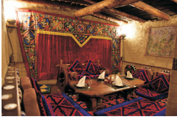
Supara Etnik Köyü (2016)

süre ile artabiliyor. 2016'da Bişkek'e gittiğimde, konferans ev sahiplerini böyle bir yurttta yemeğe davet ettim. Bu benim için özel bir deneyim oldu.