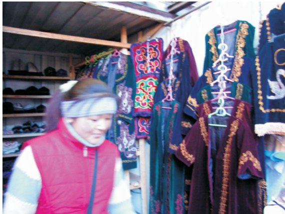
Dordoy Çarşısı (2006)

Pazarın 1992'den beri var olduğu ve 15. yıldönümünün 2007'de kutlandığı söyleniyor. Komşu Özbekistan'dan gazetecilerin görüşüne göre, Bişkek'in Dordoy Pazarı'nın yükselişinin nedenlerinden biri de Özbekistan'ın büyük toptan pazarlarının gerilemesiydi. Özbek hükümeti, Taşkent'in devasa Hipodrom Pazarı'nı 1998'de İçişleri Bakanlığı'nın yetki alanına devrettikten sonra, tüccarlara yönelik artan polis tacizi, Hipodrom'un bölgedeki hakim konumunu kaybetmesine neden oldu. 2002-2003 yıllarındaki yeniden yapılanmasının ardından, bir zamanlar 8.600 ticaret noktası ve 18.000 tüccarı olan Hipodrom'un yerini, 2.540 ticaret noktasıyla çok daha küçük olan Chilanzar mal pazarı aldı. Benzer bir olay 2006 yılında Cizzak'ta da yaşandı. Yetkililer, Çinli tüccarlar tarafından kurulan Dunyo Bozori (Özbekçe'de "Dünya Pazarı") pazar yerini kapatarak yerine Abu Sahiy Nur alışveriş merkezini açtılar. Özbekistan pazarlarının gerilemesiyle birlikte, Özbek alıcıların alışverişleri Kırgızistan'ın Bişkek veya Kara-Suu şehirlerine kaydı.