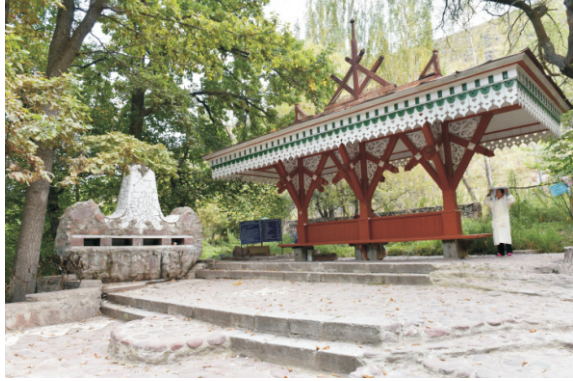
Issık Ata (2016)

Maceraperest ziyaretçiler 3,800 metre yükseklikteki Batu Dağı'nın (Botvey) zirvesine tırmanabilir. Yerel efsaneye göre dağ, zirveye ulaşamayan ve zenginliklerini derinliklerine gömen Cengiz Han'ın bir zamanlar taşıdığı hazineleri saklıyor.