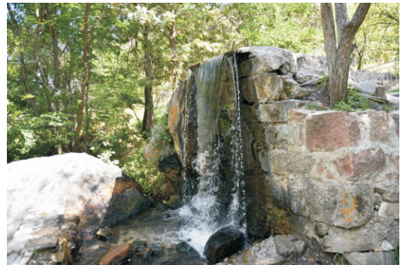
Issık Ata (2016)

Issık-Ata, Kırgızistan'ın Çuy Bölgesi'nde, başkent Bişkek'e yaklaşık 77 Km uzaklıkta bulunan bir dağ geçidi ve şifalı kaplıca merkezidir. Deniz seviyesinden 1.775 metre yükseklikte yer alır ve Tanrı Dağları'nın etkileyici doğasında dinlenmek isteyenler için uygun bir yerdir. Bölge, şifalı maden sularıyla ünlüdür. Eski Sovyet tarzı tesislerde romatizma, sinir sistemi ve sindirim rahatsızlıklarına iyi geldiğine inanılan termal banyolara girilebiliyor.