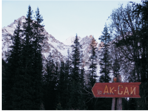
Ala-Arça Millî Parkı (2006)

Ulusal Parka adını veren Kırgızca arça (Juniperus semiglobosa)'nın, bir veya çok renkli parlak ardıç tohumları vardır, Bu ağaca, Kırgızların geleneksel olarak özel bir saygısı vardır, onun yanan odun dumanı kötü ruhları uzak tutmak kovalamak için kullanır. Aynı bölgede Rus ardıcı (Juniperus semiglobosa), 1.550-4.350 m rakımlarda yetişir. Dört farklı Ardıç türü neredeyse Kırgızistan'da ormanların yarısını kaplar, güçlü kök sistemleri ile toprak kayması ve çığ için bir engel olarak görev yapar. Huş ağacı da, dağlarda kümeler halinde yetişir.