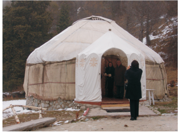
Ala-Arça Milli Parkı, Yurt (2006)

Rus kültürünün kalıntısı olan bu kutlama biçimi bizim için biraz tuhaf geliyor. Kutlamak ya da kutsamak için votka içmek. Bu durumu 1990 da Bakü'de de yaşadım. Rektörün yazlığındaki yemekte yaklaşık 20 dakikada bir kişi ayağa kalkıp şiir okudu; ardından votka kadehleri havaya. Bu kutsama gün boyu devam etti.