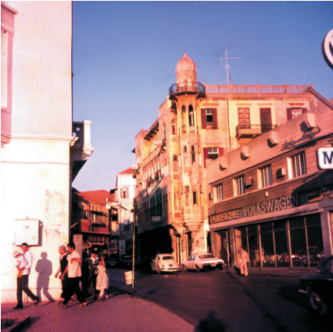
Porsche ve Volkswagen satış yeri (1973)

Beyrut'un kıyı şeridinin kuzey kısmında, Manara Bölgesinde, Cornish (Korniş) caddesi üzerinde tarihi binalar da görülmüyordu, örneğin "Pembe ev" bunlardan biri idi. Bu yapılar, Beyrut'un sayılı zenginleri tarafından yaptırılmış Akdeniz'e bakan görkemli yapılardır.