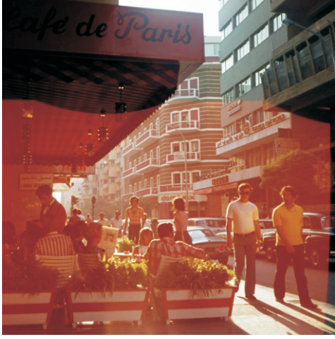
Hamra Caddesi (1973)

Benim otelin bulunduğu caddenin adı "Rue Moustafa Kamel" idi. Bu bölgede yaşayanların giysileri, o dönemde herhangi bir Avrupa kentinde görebileceğiniz giysiler ile aynıydı diyebilirim. Hamra Caddesinde, spor arabasıyla çevredekilere hava atan delikanlıları her zaman görebiliyordunuz.