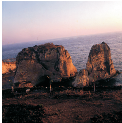
Güvercin Kayalıkları (1973)

Kent merkezi, Beyrut limanına yakın yerde ve