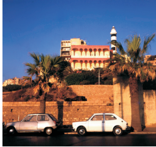
Pembe Ev (1973)

Hamra Caddesini gezdiğinizde, kendinizi Paris bulvarlarından birinde sanabilirsiniz. Caddede, kaldırım üstünde kafeler, kafelerin önünde son model spor arabalar görebilirsiniz. Bu bölgede halk genellikle Fransızca konuşuyor ve çevredeki tabelalar Fransızca.