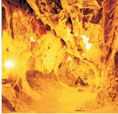
Ceyta Mağarası (1973)

Ceyta II (Dahr el-Mghara), Ceyta I'in kuru mağarası ile Ceyta III'teki mağaranın girişi arasında eşit uzaklıkta ve yukarıda yer alan bir kaya sığınağıdır. Kazılar 1864 yılında Duc de Luynes ve Lartet tarafından, 1900 ve 1908 yıllarında Zumoffen tarafından ve 1930 yılında Bergy tarafından yapılmıştır. Orinyasiyen dönemine ait olduğu düşünölen çok sayıda çakmaktaşı alet, kemik ve ocak bulunmuştur.