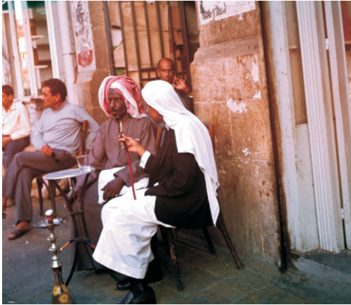
Sokakta, entarili Araplar nargile içerken (1973)

Kentin doğusuna doğru gidildiğinde görüntü değişmeye başlıyordu. İlk dikkat çeken görüntü, köşebaşlarını tutmuş olan güvenlik güçleriydi.