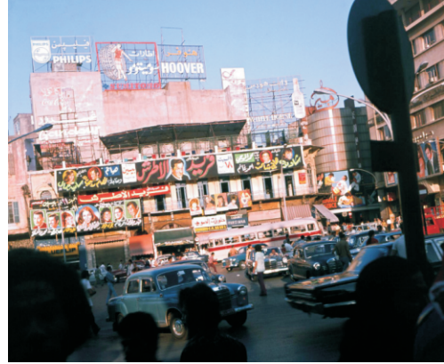
Martyrs Meydanı (1973)

Yeni camiler de yapılmış örneğin al -Aisha Bakkar Camisinin minaresi oldukça modern.