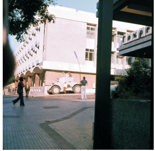
Köşebaşındaki güvenlik gücü (1973)

Hamra Caddesi çok sayıda "Sarraf" vardı. Sarraflar, bizdeki döviz bürolarının karşılığı. Bizde döviz büroları 1985'lerden sonra çalışmaya başlamasına karşın Beyrut'ta adım başına sarraf vardı. Sarraflar Türk Lirası da alıyorlardı.