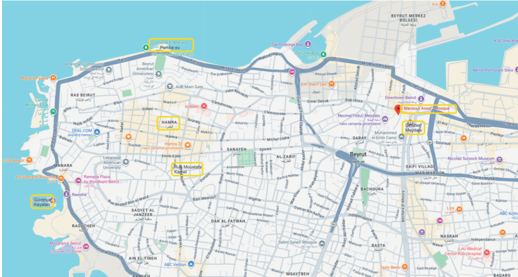
Beyrut'a gördüğüm yerler

Beyrut'un eski usul ticaret alanına girmiş olursunuz. Burada malların sırtlarda hamallar tarafından taşındığını görürsünüz.