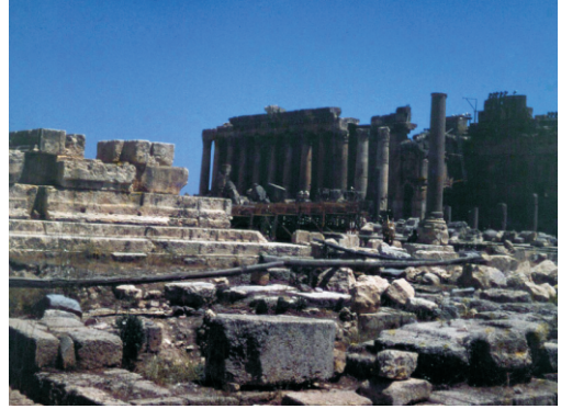
Jupiter Tapınağı (1973)

Baalbek şehri, Roma döneminde en parlak dönemini yaşamıştır. İki yüzyılı aşkın bir süre boyunca inşa edilen devasa yapıları, onu Roma dünyasının en ünlü kutsal alanlarından biri ve İmparatorluk Roma mimarisinin bir modeli haline getirmiştir. Hacılar, esasen Fenike kültü olan ve Heliopolis Üçlüsü olarak bilinen üç tanrıya (Jüpiter, Venüs ve Merkür) tapınmak için kutsal alana akın etmişlerdir.