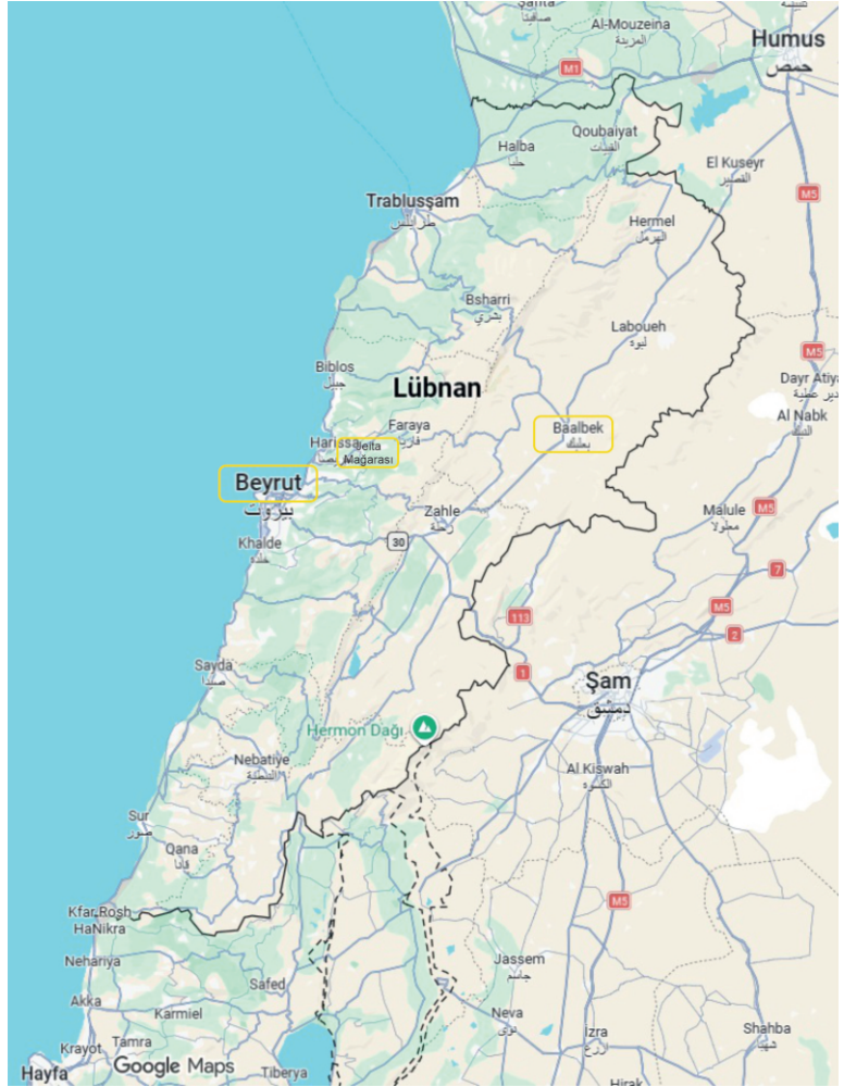
Lübnan'da gezip gördüğüm yerler

Adam memleketini özlediğini, memleketinin meyvelerini, elmasını, armudunu, karpuzunu özlediğini söyledi. Daha önemlisi memleketimde ölmek istiyorum dedi. Memleketim dediği Anadolu idi.