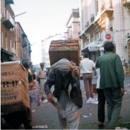
Ticaret merkezi (1973)

İki bölge arasında Osmanlı'dan kalma Emir Assaf Camisi bulunuyor. Minaresi biraz Arap tarzında da olsa, bizden kalma bir eser olarak yaşamaya devam ediyor.