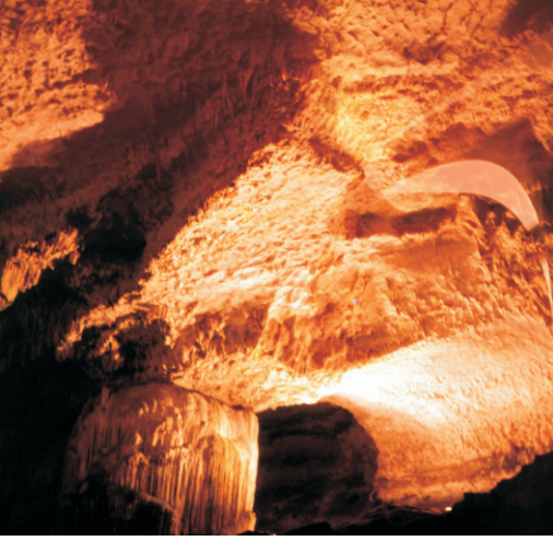
Ceyta Mağarası (1973)

1958 yılında Lübnanlı mağaracılar aşağı mağaranın 60 metre yukarısındaki üst galerileri keşfetmiş ve turistlerin doğal manzarayı bozmadan güvenli erişimini sağlamak için bir erişim tüneli ve bir dizi yürüyüş yolu inşa etmişlerdir. Üst galeriler dünyanın bilinen en büyük sarkıtını barındırmaktadır. Galeriler, en büyüğü 12 m yüksekliğe ulaşan bir dizi odadan oluşmaktadır.