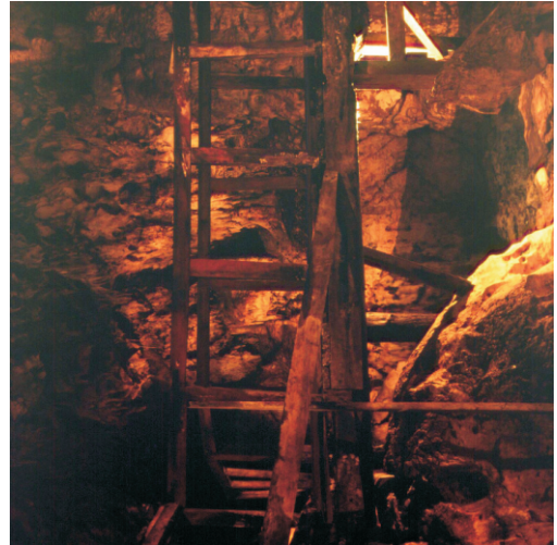
Ceyta Mağarası (1973)