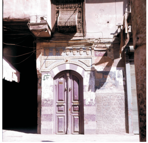
Eski Şehir (1980)

Eski Şehir Bölgeleri (Yahudi ve Müslüman Mahalleleri): Eski Şehir'in güneydoğusunda yer alan eski Yahudi Mahallesi ve batı yarısındaki Müslüman Mahallesi kentin asırlar boyunca süren kültürel mozağini oluşturur.