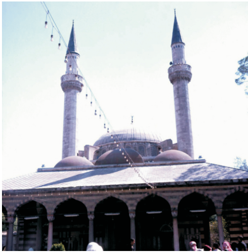
Süleymaniye Camisi (1980)

Osmanlılar, 1832-1840 yılları arasında Mısırlı İbrahim Paşa'nın kısa süreli işgali dışında, sonraki 400 yıl boyunca burada kaldılar. Mekke'ye yapılan iki büyük Hac kervanından birinin kalkış noktası olması nedeniyle Şam, büyüklüğünün gerektirdiğinden daha fazla ilgi gördü. 1559'da, Mekke yolundaki hacılar için bir cami ve han içeren Süleymaniye Takiyye'nin batı binası, ünlü Osmanlı mimarı Mimar Sinan'ın tasarımına göre tamamlandı ve kısa süre sonra bitişğinde Salimiyye Medresesi inşa edildi.