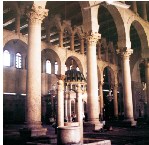
Aziz Yahya'nın başının saklandığı yer (1980)

1516 yılının başlarında, Memlükler ve Pers Safevileri arasındaki ittifak tehlikesinden endişe duyan Osmanlı İmparatorluğu,