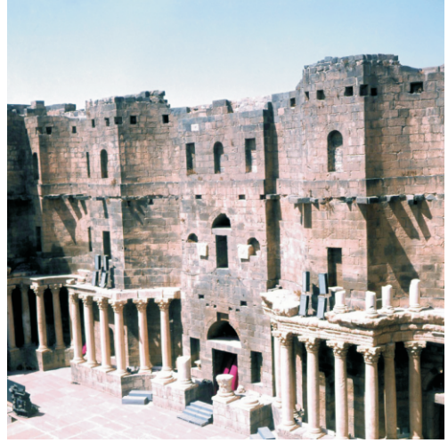
Roma Tiyatrosu, Busra (1980)

Bosra, Hz. Muhammed'in genç yaşlarında önemli bir rol oynadı. General Halid ibn el-Velid komutasındaki Raşidun Halifeliği güçleri, 634 yılında Bosra Muharebesi'nde şehri Doğu Romadan aldılar. İslam yönetimi boyunca Bosra, Bilad el-Şam'ın en güneydeki karakolu olarak hizmet etti ve refahı büyük ölçüde bu şehrin siyasi önemine bağlıydı. Bosra, Şam ile Müslümanların kutsal şehirleri Mekke ve Medine arasında, yıllık hac ibadetinin varış noktaları olan hac kervanının merkezi olarak ek bir öneme sahipti. Erken İslam yönetimi, Bosra'nın genel mimarisini değiştirmede. Şam'ın Halifeliğin başkenti olduğu Emevi dönemine (721 ve 746) ait sadece iki yapı bulunmaktadır. Bosra sakinleri yavaş yavaş İslam'a geçtikçe, Roma dönemine ait kutsal yerler Müslüman ibadetleri için kullanıldı.