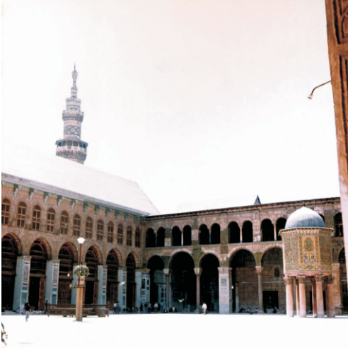
Emevi Camisinin Avlusu ve Kubbetü'l-hazne (1980)

ve nefler arasında mermer sütunlar üzerinde yükselen iki kat halinde düzenlenmiş kemerler bulunmaktadır.