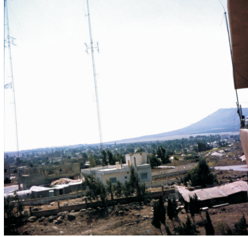
İsrail sınırı ve Golan tepesi (1980)

Tepelerden gelen yağmur suları Ürdün Nehri'ni besliyor ve etrafındaki toprakları üzüm bağları ve meyve bahçelerine uygun hale getiriyor, ayrıca hayvanlara otlatıyor.