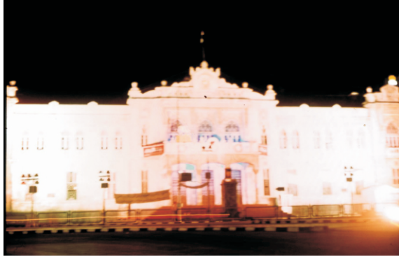
Hicaz Tren İstasyonu (1980)

Bina, Şam'ın merkezindeki Merce Meydanı yakınında bulunur ve Osmanlı mimarisinin zengin süslemelerine sahiptir.