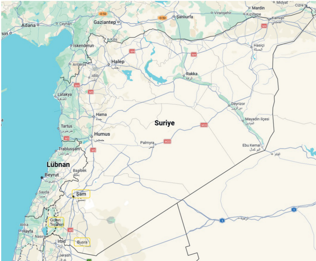
Suriye'de gördüğün yerler (1980)

Uçak gecenin geç bir vaktinde havalandı ve sabaha karşı Şam'a vardık. Beni karşıladılar. Hava limanı bir köy otobüs garı gibiydi. Kızın durumunu açıkladım ve önce onu evine bıraktık ardından ben otele yerleştim. Ertesi gün kızın ailesi beni buldu ve Şam'da bulunduğum süre içinde bana yardımcı oldular; beni gezdirdiler.