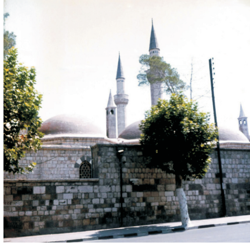
Süleymaniye Camisi (1980)

Camiye daha sonra bir medrese eklenmiş ve tekke olarak faaliyet göstermiştir. Cami pandantiflere (Kare veya çokgen planlı bir mekanın üzerine kubbenin oturmasını sağlayan, köşelerdeki tonozlu geçiş ögesidir) dayalı bir kubbeyle örtülüdür. Önünde üç kemerli ve küçük kubbeyle kapatılmış bir son cemaat yeri ve bunun çevresinde üç yandan sütunlara dayanan önde yedi, yanlarda üçer kemerli, eğimli bir çatı ile örtülü revak bulunmaktadır.