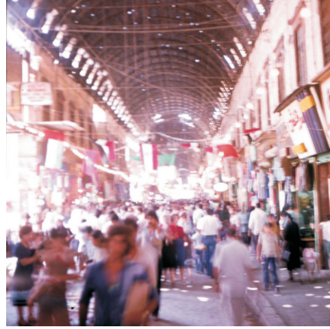
Hamidiye Kapalı Çarşısı (1980)

El-Hamidiye Çarşısı (Suq al-Hamidiyyah), Şam'ın eski surlarla çevrili şehrinin içinde, Kale'nin yanında bulunan Suriye'nin en büyük ve merkezi çarşısıdır. Çarşı yaklaşık 600 m uzunluğunda ve 15 metre genişliğindedir ve 10 metre yüksekliğinde metal bir kemerle örtülüdür. Çarşı, El-Sevra Caddesi'nden başlar ve Emevi Camii meydanında sona erer. Girişinde ise antik Roma Jüpiter Tapınağı 12 m yüksekliğindedir.