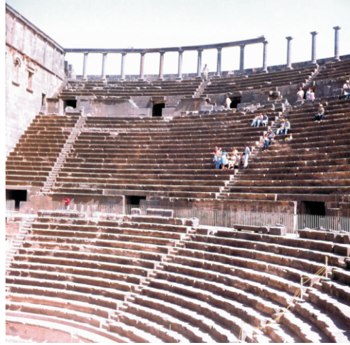
Roma Tiyatrosu, Busra (1980)

Tarihi boyunca çeşitli Müslüman yöneticiler altında şehir, Suriye'nin güney kapısı olarak stratejik önemini korudu. Şam yöneticilerinin dikkatini çekti ve çeşitli beyler tarafından yönetilerek İslami öğrenim ve vakıflar için bir merkez görevi gördü. Ancak Osmanlı döneminde bir köye dönüştü, ancak XX. yüzyılda Hicaz demiryolunun inşası ve artan arkeolojik ilgiyle yeniden canlandı ve daha sonra Suriye hükümeti tarafından turizm odaklı bir gelişmeye yol açtı. Bugün önemli bir arkeolojik alan olup UNESCO tarafından Dünya Mirası Alanı ilan edilmiştir.