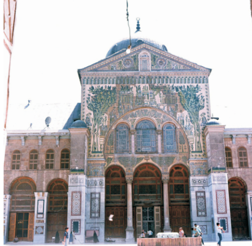
Emevi Camisi (1980)

1126'da, II. Baldwin liderliğindeki Haçlı ordusu, Şam yakınlarındaki Marj el-Saffar'da Toghtekin liderliğindeki Burid güçleriyle savaştı. Haçlılar Şam'ı ele geçiremediler.