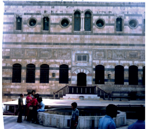
El-Azm Sarayı (1980)

Saray, üç yıl içinde 800 işçi tarafından inşa edilmiş ve bina, incelikli ve pahalı dekoratif