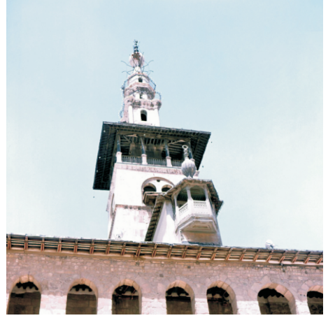
Emeviye Camisi'nin Mi'zenetü'l-arus denilen minaresi (1980)

Cami alanı sadece Hz. Yahya için değil, aynı zamanda İslam tarihi açısından büyük öneme sahip Hz. Hüseyin'in Kerbela sonrası başının bir süre tutulduğu kabul edilen makama ve cami avlusunda Selahaddin Eyyubi'nin türbesine ev sahipliği yapar.