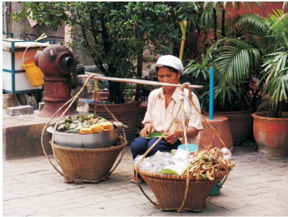
Seyyar satıcı (2008)

2004 Hint Okyanusu depremi ve tsunamisi sırasında en çok can kaybı yaşanan ülkelerden birisi de Tayland