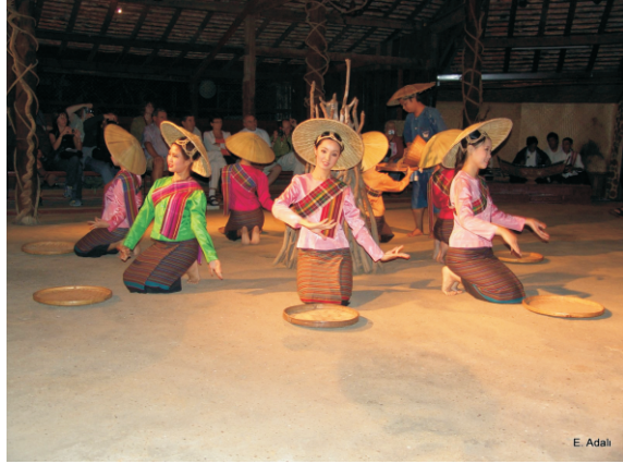
Konferans sonrası yemek ve gösteri (2008)

Loi Krathong Festivali ve Yi Peng Festivali'nden sonra bu gösteriler, bende şöyle bir yoruma neden oldu: Sanki bu insanlar festival, dans ve gösteriler için yaşıyorlar.