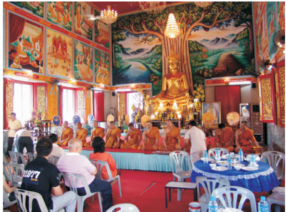
Ölü anma töreni (2008)

Khlong Saen Saep Kanalı'na gitmek üzere otelimizden yola çıktığımızda küçük bir tapınağa denk geldik. İçerisine baktığımızda rahipler (mong) ve insanları görünce ilgimizi çekti ve içeri girdik. Bir yıl önce ölmüş birisi için anma ya da dua ediyorlardı. Monglar birbirine iple bağlıydı ve ipin ucu tapınağın saçağındaki heykellere kadar gidiyordu. Monglar sanki ilahi söylüyorlardı. Diğer kişiler yalnızca dinliyorlardı. Mongların yanında öbür dünyaya göçmüş kişinin fotoğrafı ve bazı eşyaları bulunuyordu.