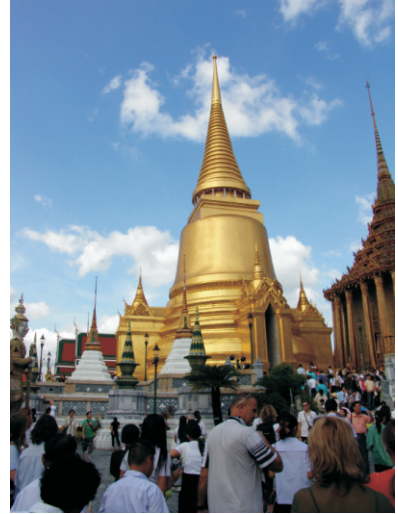
Phra Sri Ratana Chedi (2008)

Zümrüt Tapınağın üst terasında (Than Phaithi) yer alır. Bu terasta ayrıca kutsal metinlerin korunduğu Phra Mondop ve Tayland krallarının heykellerinin bulunduğu Prasat Phra Thep Bidon (Kraliyet Pantheon'u) gibi önemli yapılar da bulunur.