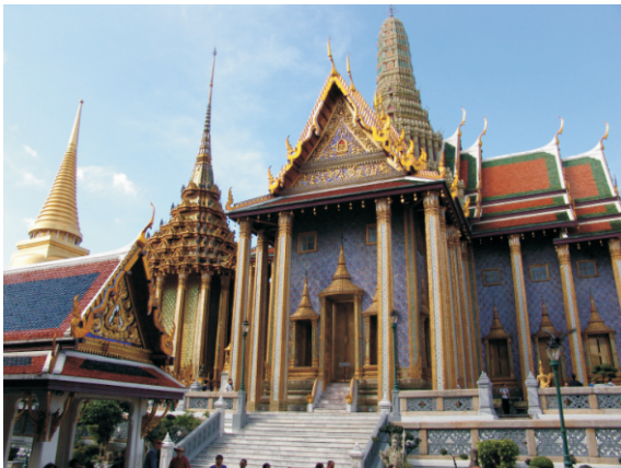
Zümrüt Tapınağı (Wat Phra Kaew) Phra Ubosot (Dua Salonu) (2008)

Kraliyet tapınağı olarak Wat Phra Kaew, kral ve kraliyet ailesi tarafından gerçekleştirilen Budist dini ayinlerinin, taç giyme törenleri, kraliyet atamaları ve yüce patrik atamaları gibi önemli etkinliklerin yapıldığı yer olmaya devam etmektedir. Kral veya bir temsilcisi ayrıca tapınakta Visakha Puja, Asalha Puja ve Magha Puja gibi önemli Budist bayramlarını kutlayan yıllık törenlere katılır. Yılda üç kez, mevsimlerin değişimini işaret eden kraliyet töreninde Zümrüt Buda heykelinin altın giysileri değiştirilir. Ayrıca Chakri Anma Günü, Kraliyet Çiftçilik Töreni, Kralın Doğum Günü ve Songkran'da (geleneksel Tay yeni yılı) yıllık ayinler düzenlenir. Diğer günlerin çoğunda, tapınak, Büyük Saray'ın bazı