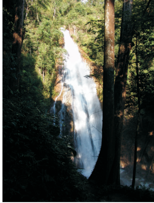
Khun Korn Selalesi (2008)

Khun Korn Şelalesi, çevrede yaşayanlar için uzun zamandır hayati bir su kaynağı olmuştur. Geçmişte, yerel halk, şelalenin eğimli kaya yüzeyine çarpan suyun oluşturduğu ince sis nedeniyle, sürekli bir sis perdesine benzeyen görüntüsü nedeniyle buraya "Tat Mok Şelalesi" adını vermiştir. Bu sis, muson sonrası dönemde daha da yoğunlaşarak şelalenin gizemli güzelliğini artırıyormuş.