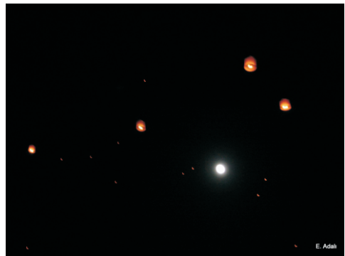
Işıklı fenerler (2008)