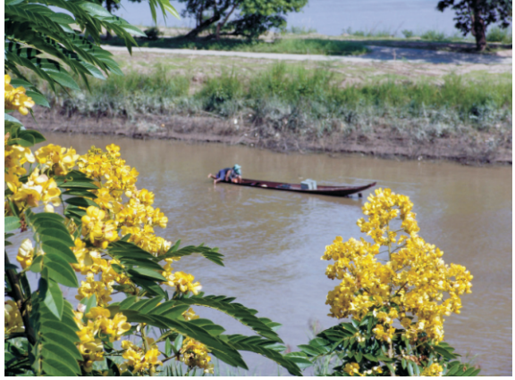
Altın Üçgen (2008)

Bölgenin adı tarihinden geliyor. Altın Üçgen bir zamanlar küresel afyon üretiminin başkenti ve uluslararası afyon ticaretinin merkeziydi. Bu kazançlı madde kelimenin tam anlamıyla "altın değerindeydi", çünkü bir kilo afyon bir kilo altınla takas edilebiliyordu. Altın Üçgen'in engebeli tepeleri bir zamanlar afyon hasadı ve özütlenmesi için kullanılan renkli haşhaş tarlalarıyla doluydu ve dağ kabilelerinin köyleri uyuşturucunun üretimi, kullanımı ve ticaretinde yoğun olarak yer alıyordu. Tayland 1970'lerden sonra afyon satışını yasakladı, üretim ve kaçakçılığa karşı sert önlemler aldı ve sebze ve çay gibi sağlıklı ürünlerin üretimini teşvik etti.