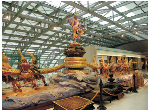
Suvarnabhumi Uluslararası Havaalanı (2008)

Ülkenin turizm merkezi başkent Bangkok şehridir. Suvarnabhumi Uluslararası Havaalanı vasıtasıyla her yıl milyonlarca turist ülkeye giriş yapmaktadır. Bangkok'taki Büyük Saray ve Wat Pho gibi tarihi yapıların ve müzelerin büyük bölümü Ko Rattanakosin bölgesinde bulunmaktadır. Çin Mahallesi ve Dusit tarihi eserler açısından zengin diğer bölgelerdir. Siam bölgesi Bangkok'un merkezi olarak kabul edilmektedir ve