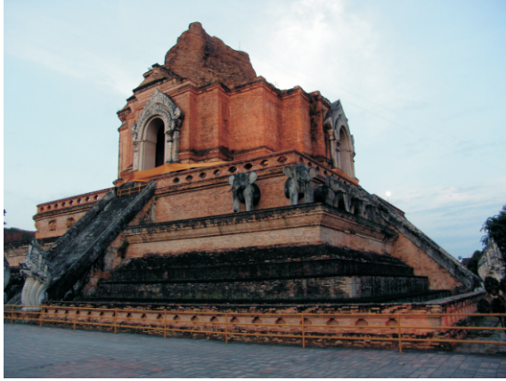
Wat Chedi Luang (2008)

Chiang Mai (Tay dilinde "yeni şehir" anlamına gelir), eski başkent Chiang Rai'nin yerine Lan Na'nın yeni başkenti olarak 1296'da kuruldu. Şehrin Ping Nehri (Chao Phraya Nehri'nin önemli bir kolu) üzerindeki konumu ve önemli ticaret yollarına yakınlığı, tarihi önemine katkıda bulundu.