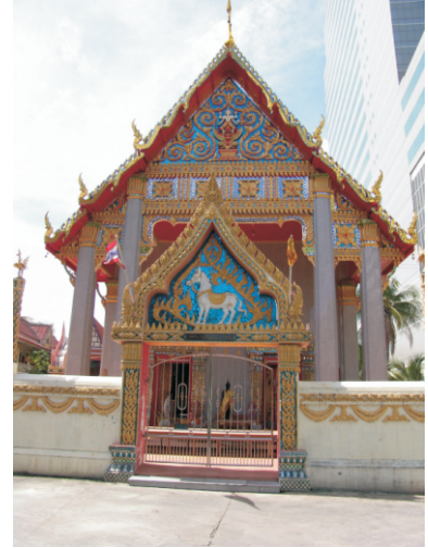
Wat Muang Khae Tapınağı (2008)

Tapınak, Kral Vajiravudh (Rama VI) döneminde, kişisel himayesi altındaki kraliyet paramiliter birliği olan Vahşi Kaplan Kolordusu için bir eğitim alanı olarak kullandığı için "Wat Phlapphla Chai" olarak yeniden adlandırılmıştır. "Zafer Pavyonu" anlamına gelen yeni isim, bölgede gerçekleştiğine inanılan tarihi bir olayı anmak için seçildi. Yerel geleneğe göre, burası, o zamanlar hala Chao Phraya Maha Kasatsuek unvanını taşıyan Kral Phutthayotfa Chulalok'un (Rama I) Kamboçya'daki askeri seferinden dönüşünde kullandığı güzergah üzerindedir. Rivayete göre, burada bir kraliyet çadırı kurulmuş ve iç şehre girmeden önce bir gece geçirmiştir.