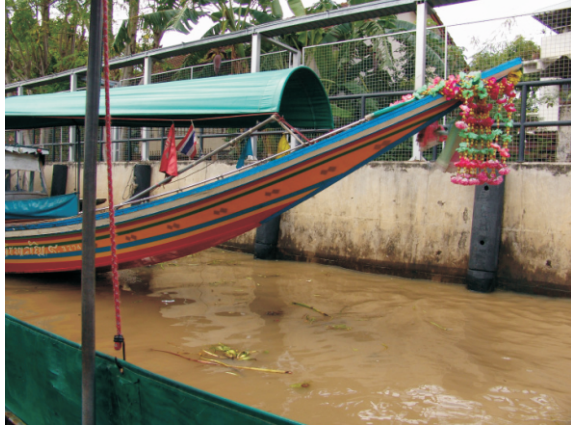
Nehir ile kanal arasındaki yükseklik farkının giderildiği havuz (2008)

Saen Saep Kanalı, Bangkok'un başlıca drenaj arterlerinden biridir. Aynı zamanda ağır derecede kirlidir.