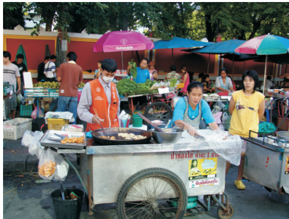
Bangkok, Sokak lokantaları (2008)

Ayutthaya'nın işgalinden sonra yetenekli bir askeri lider olan Chao Tak asker toplamış ve yalnızca yedi ay sonra