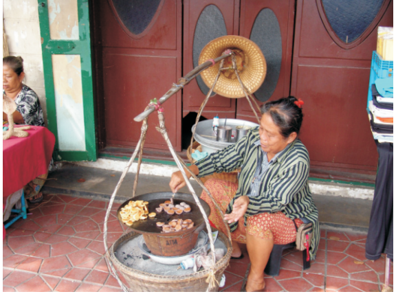
Gezgin lokanta (2008)

Rattanakosin'in genişlediği bölge olan Banglamphu'da ise görece daha yeni tarihi eserler bulunmaktadır. Bunların en önemlileri Altın Dağ olarak da bilinen Wat Saket, Wat Ratchanadda ve Zafer anıtıdır. Banglamphu'dan sonra şehrin genişlemeye devam ettiği bölge olan Dusit ise büyük ölçüde batı tarzında bir mimariye sahiptir. Ülkesini batı standartlarına taşımayı hedeflemiş olan Kral Rama V burada Mermer Tapınak olarak da bilinen Wat Benchamabophit, Dusit Sarayı, Vianmek Tik Konağı gibi batı tarzında yapılar inşa ettirmiştir.