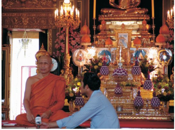
Wat Ratchabophit Tapınağı (2008)

Tapınak alanının batı ucunda, Tay Kraliyet Ailesi'nin büyük ve küçük üyelerine, özellikle de Kral Chulalongkorn'un yakın ailesine ait çok sayıda anıtın bulunduğu Kraliyet Mezarlığı yer almaktadır. Anıtlardan biri olan Rangsi Vadhana Anıtı, Mahidol Adulyadej, Srinagarindra ve Galyani Vadhana'nın küllerini içermektedir. Alanda bir Hristiyan kilisesi, birçok çedi ve Khamer yüzlü kule bulunmaktadır.