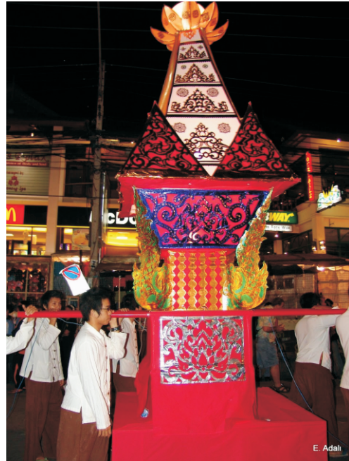
Loy Krathong Festivali (2008)

Binlerce pirinç kağıdından yapılmış fener (Khom Loi), yakılarak gökyüzüne bırakılır. Bu hem kötü şansu uzaklaştırmaya hem de Budist inancına göre gökyüzündeki kutsal bir anıta ışık sunmaya yarar. Loy Krathong ile birlikte kutlanır. Tayland'ın en ilginç festivallerinde biridir ve bir zamanlar Lanna krallığının başkenti olan Chiang Mai şehrinde düzenlenir. Genellikle ülke çapında kutlanan Loy Krathong ile aynı zamana denk gelir.