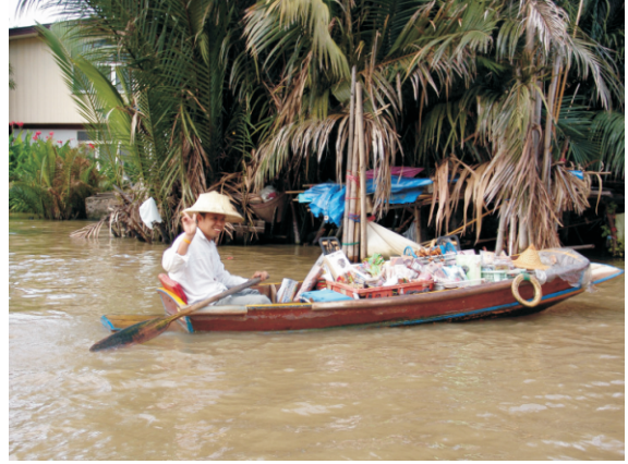
Kanalda hizmet veren gezgin bir bakkal (2008)

Kanalı görmeye ve gezmeye gelen bizler için bir gösteri merkezi bile kurulmuş. Bu merkezde maymunları izleyebileceğiniz gibi bazı canlı gösterileri de izleyebiliyorsunuz. Hatta bazı hayvanlara dokunabiliyorsunuz. Çıngıraklı bir yılan ile korkusuz Taylandlının yaptığı gösteri ilgin sayılabilir.