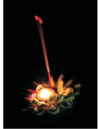
Dilek kayığı (2008)