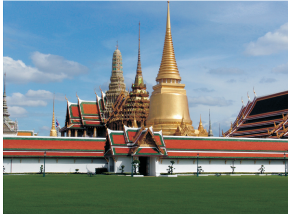
Grand Palace (2008)

Büyük Saray (Tay dili: Phra Borom Maha Ratcha Wang: "Yüce Büyük Saray" anlamındadır.) Bangkok'un merkezinde yer alır. Saray, 1782'den beri Siam (ve daha sonra Tayland) krallarının resmi ikametgahı olmuştur. Kral, sarayı ve kraliyet hükümeti 1925 yılına kadar sarayın arazisinde yer almıştır. Kral Bhumibol Adulyadej (Rama IX), Chitralada Kraliyet Villası'nda yaşamış ve ardılı Kral Vajiralongkorn (Rama X) ise Dusit Sarayı'ndaki Amphorn Sathan Konut Salonu'nda oturmaktadır. Ancak Büyük Saray hala resmi etkinlikler için kullanılmaktadır. Her yıl sarayın duvarları içinde çeşitli kraliyet törenleri ve devlet etkinlikleri düzenlenmektedir. Saray, her yıl sekiz milyondan fazla ziyaretçisiyle Tayland'ın en bilindik turistik yerlerinden biridir.