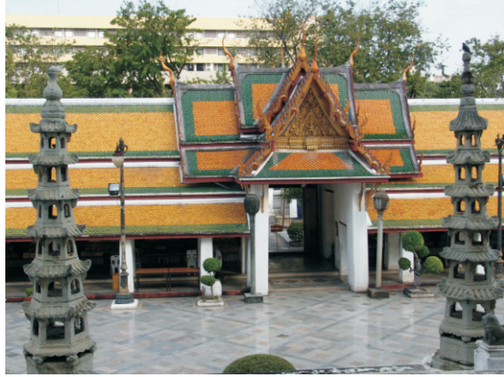
Wat Suthat Thepwararam Tapınağı (2008)

Wat Suthat'ın ubosotu, Tayland'ın en uzun ibadet salonu olarak kabul edilir. Ana heykeli olan Phra Buddha Trilokachet, Maravijaya (Mara'yı alt eden) duruşunda bir Buda'dır. Hem ubosot hem de bu heykel Kral Rama III dönemine aittir. İç duvarlar, o dönemin saray sanatçıları tarafından yapılmış duvar resimleriyle kaplıdır. Kapı ve pencere çerçeveleri,