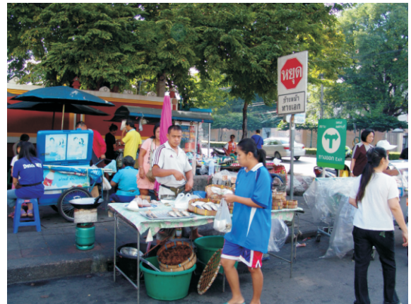
Sokak lokantası (2008)