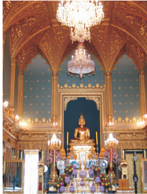
Wat Ratchabophit Tapınağı (2008)

Tapınak, ortasında yıldızlı bir çedi bulunan dairesel bir avlu ile birbirine bağlanan wihan ve ubosot'uyla benzersiz bir düzene sahiptir. Altın çedi (43 m yüksekliğinde) turuncu renkli fayanslarla kaplıdır ve çedinin tepesinde altın bir top bulunmaktadır. İçeride Buda'nın bir kalıntısı vardır ve çedi Sri Lanka tarzında inşa edilmiştir. Rahiplik salonunun her biri içten yıldızlı siyah lake ile süslenmiş 10 kapı paneli ve 28 pencere paneli vardır.