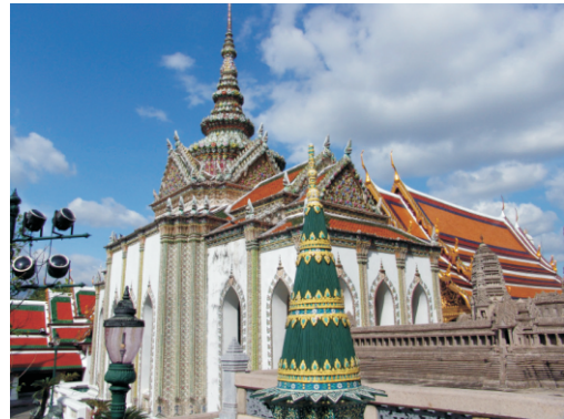
Wihan Yod Tapınağı (2008)