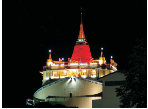
Wat Saket (Altın Dağ) Tapınağı (2008)

Phu Khao Thong ("Altın Dağ"), Wat Saket yerleşkesinin içindeki dik bir yapay tepedir. Rama I'in torunu Kral Rama III (1788–1851), Wat Saket'in içine devasa boyutlarda bir çedi inşa etmeye karar verdi, ancak Bangkok'un yumuşak toprağı ağırlığı taşıyamadığı için çedi inşaat sırasında çöktü. Sonraki birkaç on yılda, terk edilmiş kerpiç yapı doğal bir tepe şeklini aldı ve yabancı otlarla kaplandı. Yerliler ona doğal bir özellikmiş gibi phu khao ('dağ') adını verdiler. O dönemde, düşman ordularının gelişinden endişe duyan askerler için bir gözetleme kulesi olarak da işlev gördü.