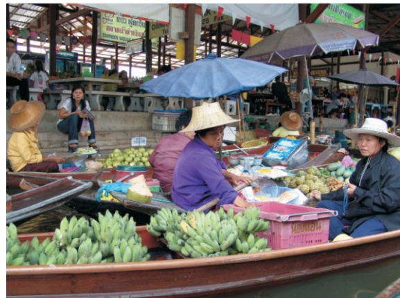
Damnoen Saduak Yüzen Pazarı (2008)

Yüzen pazar Bangkok'dan yaklaşık 100 Km uzaklıkta. Buraya özel aracıyla hizmet veren bir kişinin arabasıyla gitti. Pazara ulaşmayı sağlayan kanallar doğal güzellik sunuyor. Sıcak havada gölge ve su insanı rahatlatıyor. Bizim amacımız pazarı görmek idi dolayısıyla alışveriş ile ilgilenmedik. Pazarda satılan ürünler bölgede yaşayanlara yönelik olduğu gibi gezginler için de hediyelik ürünler var. Pazarda yabancı para bozdurabilecek