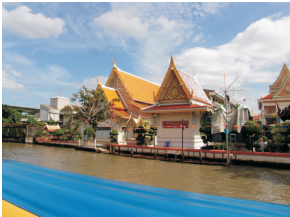
Khlong Saen Saep Kanalı'nda bir tapınak (2008)

Kanalın iki tarafında çok farklı yapılar görebiliyorsunuz. Derme çatma gecekondular görebileceğiniz gibi modern yapılar da görebiliyorsunuz. Bazı evlerde tekneleri için park yerleri bile var.