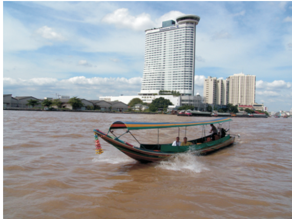
Chao Phraya Nehri (2008)

Chao Phraya Nehri, Nakhon Sawan eyaletindeki Nakhon Sawan'da Ping ve Nan nehirlerinin birleştiği noktadan başlar. Bundan sonra, orta ovalardan Bangkok'a ve Tayland Körfezi'ne doğru 372 kilometre (231 mil) boyunca güneye akar. Chai Nat'ta nehir, ana kol ve Tha Chin Nehri olmak üzere ikiye ayrılır; Tha Chin Nehri daha sonra ana nehre paralel akar ve Bangkok'un yaklaşık 35 kilometre (22 mil) batısında, Samut Sakhon'da Tayland Körfezi'ne dökülür.