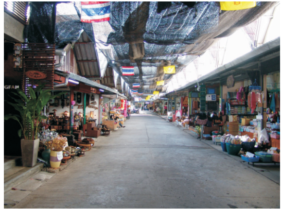
Bangkok Sokakları (2008)

Çulalongkorn olarak da bilinen Kral V. Rama ülkesini batı standartlarına getirmek için önemli reformlara imza atmıştır ve bu yüzden Tay toplumunda kendisine karşı büyük bir saygı beslenmektedir. Neredeyse bir yarı-tanrı olarak kabul edilen Çulalongkorn'un heykelleri kimi tapınaklarda Buda heykelleri ile yan yana bulunmaktadır. Çulalongkorn babasının denge politikasını devam ettirmiştir, ancak Tayland bu dönemde toprak kaybına uğramıştır. Başta Mekong nehrinin doğusunda yer alan günümüz Laos sınırları içerisindeki bölge ve Malay Yarımadası olmak üzere, daha önce Siyam sınırları içinde bulunan bazı bölgeler Avrupalı devletlerin yönetimine geçmiştir ve Tayland günümüzdeki sınırlarına çekilmiştir.