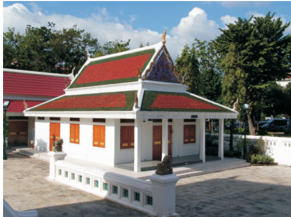
Wat Makut Kasatriyaram Ratchaworavihan Tapınağı (2008)

Wat Mongkut (Rama IV), Tayland tarihinin en ünlü krallarından biridir. Batılılar onu aslında Anna Leonwen'in yazdığı ünlü roman "Kral ve Ben" ile tanırlar, ancak ne yazık ki bu roman Tayland'da halk için yasaklanmıştır. Bu tapınak, Rama IV'ün saltanatının tapınağı olarak kabul edilebilir. Kendisi için bu tapınağı ve çevresindeki manastırı kurmuştur. Ayrıca çok genç yaşta hamilelik rahatsızlığı nedeniyle ölen en sevdiği kraliçesi (adı Kraliçe Sommanas) için de benzer bir planda yakındaki diğer tapınağı inşa ettirmiştir. Bu nedenle, tapınak çifti gerçekten oldukça