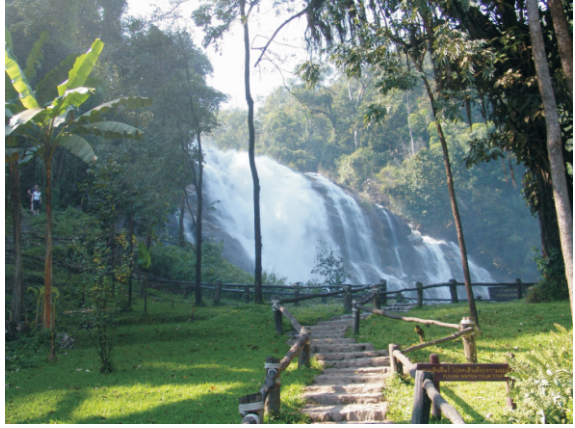
Wachiratan (Wachirathan) Şelalesi (2008)

Doi Inthanon Milli Parkı'nda yer alan Wachiratan (Wachirathan) Şelalesi, 80 metrelik etkileyici yüksekliği ve gürül gürül akan sularıyla ünlüdür. Zengin doğasıyla dikkat çeken bu şelale, ziyaretçilere serin bir atmosfer ve muhteşem gökkuşağı manzaraları sunuyor; biraz da ıslatıyor.