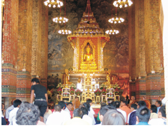
Zümrüt Tapınağı (Wat Phra Kaew) içi (2008)

güzel mücevherini içeren tapınak" anlamına gelen Wat Phra Si Rattana Satsadaram resmi adı verildi. Tapınağın ana salonu, kralın ikametgahı hala ahşaptan yapılmışken, tüm saray kompleksinde taştan tamamlanan ilk yapıydı. Tapınak kompleksi, Büyük Saray'ın Dış Avlusunun kuzeydoğu köşesine inşa edildi. Şubat 1785'te, Zümrüt Buda, büyük bir törenle Thonburi'deki Wat Arun'daki eski yerinden nehrin karşı yakasına, Rattanakosin tarafına taşındı ve şimdiki yerine yerleştirildi.