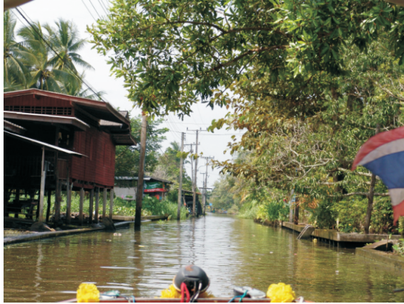
Damnoen Saduak Yüzen Pazarı (2008)

1971 yılında, Tayland Turizm Otoritesi (TAT), Lad Plee pazarını yabancılar için bir turistik cazibe merkezi haline getirdi. Pazarda, kanal kıyılarında tekne satıcıları ve dükkanlar bulunuyordu. 1981 yılında Ton Kanalı'na yeni bir yol inşa edildi ve özel girişimciler bu kanal boyunca modern Damnoen Saduak Yüzen Pazarı'nı kurdu.