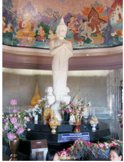
Phra Mahathat Nabhapolbhumisiri (2008)

Ülkenin en yüksek tepesine kurulan bu ikiz pagodaların bulunduğu yerden dağ silsilesi 360 derecelik açıyla görülebilmektedir. Dağların üzerinden geçen "sis denizi"ni görülebilmektedir.