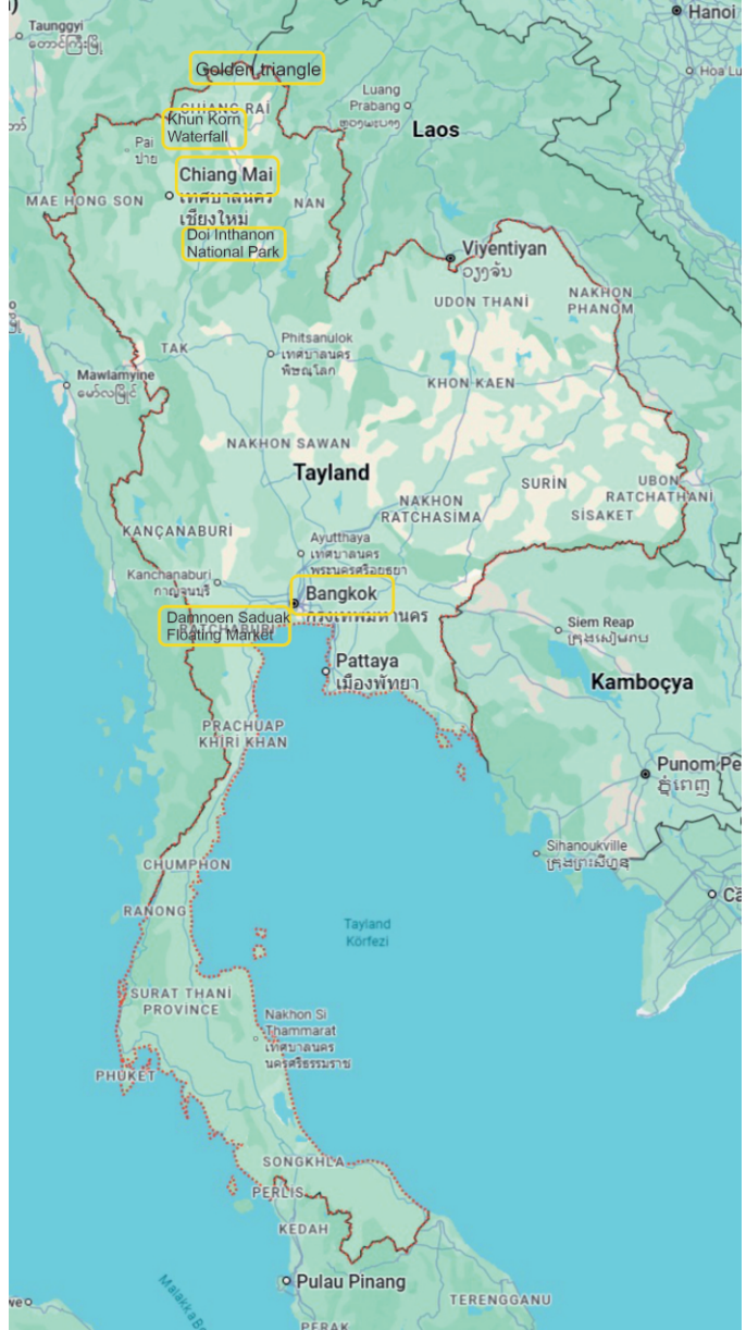
Tayland'da gezip gördüğüm yerler

Tayland'da gezip gördüğüm yerler haritada işlenmiştir.