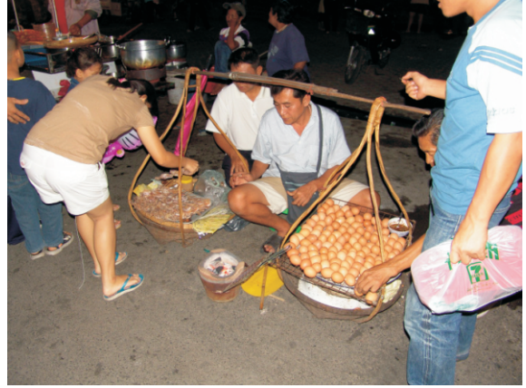
Bangkok akşam pazarı (2008)

Festivaller: Tayland genelinde her dönem bir festivale denk gelebiliyorsunuz. Bangkok'ta bulunduğumuz süre içinde bir festival çoktu ancak hava karardıktan sonra Büyük Saray çevresi panayır yerine dönüyordu. Yumurta satan, sebze meyve satan, masaj yapanlar ve aklınıza gelebilecek her şey.