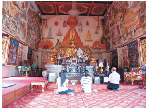
Wat Intharawihan Tapınağı'nda dua edenler (2008)

Tapınakta başrahip olan Phra Puttachedan'ın bir görüntüsü, tapınakta yeni inşa edilen ayrı bir odada muhafaza ediliyor. Resim balmumundan yapılmıştır ve bir su kaynağının üzerine yerleştirilmiştir. Tayland'ın çeşitli bölgelerinden toplanan sular, hazne içindeki raflara yerleştirilen kaplarda muhafaza ediliyor. Balmumu görüntüsünün korunması için klima