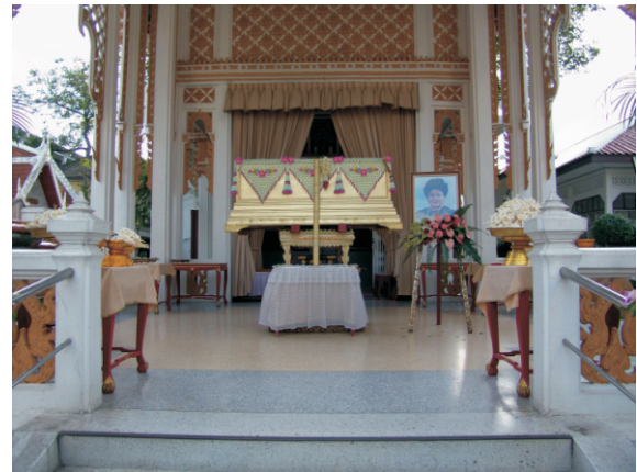
Ölü Yakma Yeri (2008)

Bu kadar tapınak gezince ölü yakma yerini de görmek gerekti, aslında denk geldi. Tayland'da ölüleri, ölü yakma