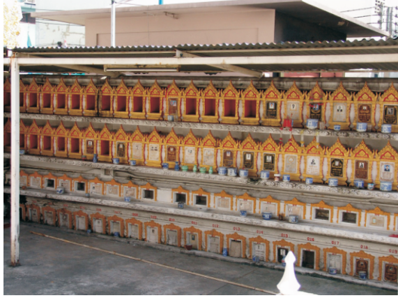
Ölülerin küllerinin saklandığı kavanozlar (2008)

Tapınağın dışında raflara dizilmiş çok sayıda çerçevesiz kutu ya da vazo duruyordu. Bunları incelediğimizde, ölmüşlerin küllerinin saklandığı kavanozlar olduğunu anladık. Her birini üzerinde ölünün adı yazılıydı; bazılarında fotoğrafları vardı. Bir anlamda mezarlık diyebiliriz.