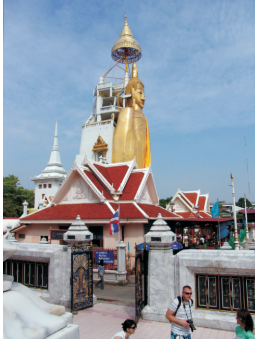
Wat Intharawihan Tapınağı (2008)

Tapınak, Ayutthaya Krallığı'nın başlangıcında inşa edilmiş ve başlangıçta Wat Rai Phrik "Sebze Tarlaları Tapınağı" olarak adlandırılan, III. Sınıf olarak sınıflandırılan bir kraliyet