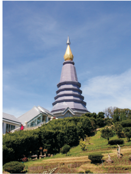
Phra Mahathat Nabhapolbhumisiri (2008)