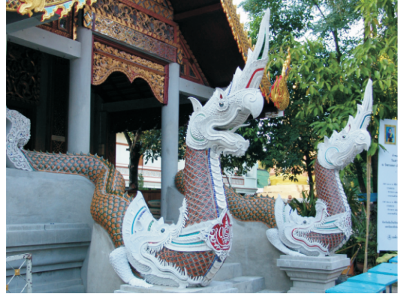
Tapınak Girişindeki Naga (mitolojik yılan) heykeli (2008)

Mayıs 2006'da Chiang Mai, ASEAN ve "ASEAN+3" ülkeleri (Çin, Japonya ve Güney Kore) arasında imzalanan Chiang Mai Girişimi'ne ev sahipliği yaptı. Chiang Mai, Tayland'ın 2020 Dünya Expo'suna ev sahipliği yapma teklifi için yarışan üç Tayland şehriden biriydi. Ayutthaya, uluslararası yarışmaya katılmak üzere Tayland parlamentosu tarafından nihayetinde seçildi.