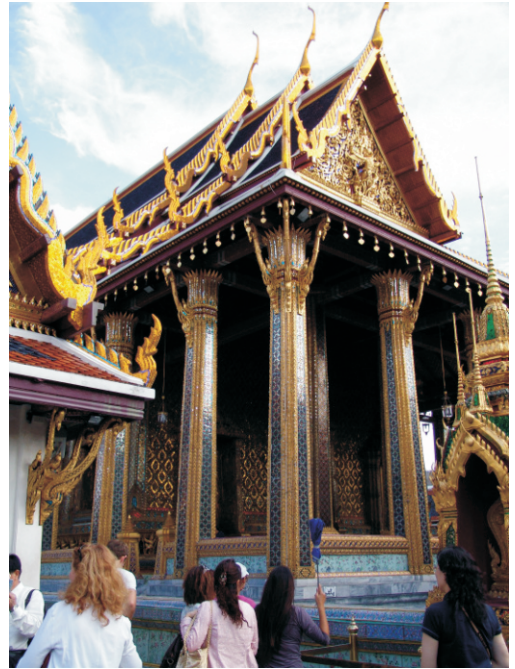
Zümrüt Buda Tapınağı (Wat Phra Kaew) (2008)

Tapınağın inşasına 1783 yılında başlandı. Tapınağa, "ilahi öğretmenin manastırının