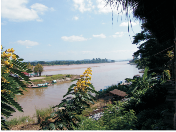
Altın Üçgen (2008)

Kuzeydoğu Myanmar'da üretilen afyon ve eroin bazı, eroin ve eroin bazına dönüştürülmek üzere Tayland-Burma sınırındaki rafinerilere at ve eşek kervanlarıyla taşınıyordu. Bitmiş ürünlerin çoğu, sınırın ötesine, Kuzey Tayland'daki çeşitli kasabalara ve oradan da uluslararası pazarlara dağıtılmak üzere Bangkok'a sevk edilmekteydi.