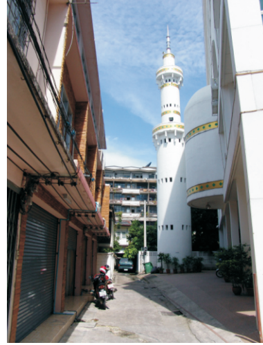
Hidayatul Islam Camisi (2008)

Bu sırada bir sözü hatırladım: " Bazı insanlar bilgiye erişmek için okumayı öğrenirler; bazı insanlar yalnızca okuyabilmek için okumayı öğrenirler ". Bu sınıfta gördüklerim bana ikinci kümedeki insanları çağırıyordu.