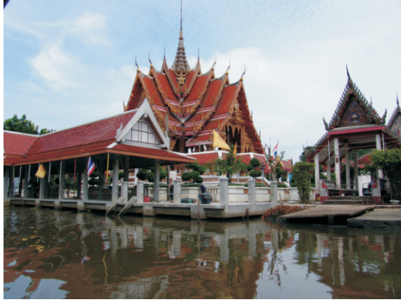
Mahabut Tapınağı (2008)

Damnoen Saduak Yüzen Pazar'da dükkanların dışında tapınaklar da var. Bunlardan birini ziyaret ettik. Tapınağın adı Mahabut idi ve Ayutthaya'nın düşüşünden 5 yıl önce, 1762'de Phra Khanong bölgesinde inşa edilmiştir. Diğer Bangkok tapınaklarının aksine, Wat Mahabut tarihi mirası veya eski mimarisiyle ünlü değildir. Bu tapınak, efsanevi Mae Nak adlı bir kadının hayaletiyle bilinir. Tapınak, burada kalan ilk keşişin adı olan Phra Mahabut'tan adını almıştır. Wat Mahabut tapınağının diğer adı Wat Mae Nak Phra Khanong, yani Anne Nak Phra Khanong Tapınağı'dır.