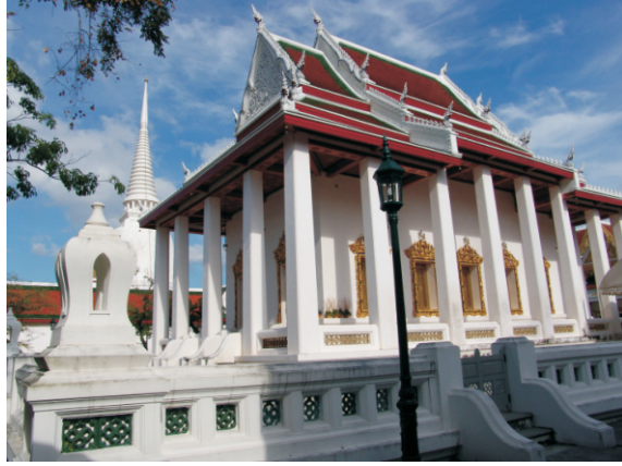
Wat Thepthidaram Worawihan Tapınağı (2008)

Tapınakta, Çin ve Siam (o dönemde Tayland) arasındaki gelişmiş ticaretin yanı sıra Wat Pho , Wat Suthat , Wat Ratcha Orasaram gibi diğer tarihi tapınaklar sayesinde, güzel desenlere sahip birçok eşya, porselen ve Çin bebekleri bulunmaktadır. İbadet salonunda, Kral Rama III'ün Kraliyet Sarayı'ndan tapınağa getirttiği ve bu nedenle Luang Pho Khao (beyaz saygıdeğer baba) adını alan, saf beyaz taştan oyulmuş ana Buda heykeli, Wetchayan Butsabok'un (küçük boyutlu mandapa ) içinde muhafaza edilmektedir .