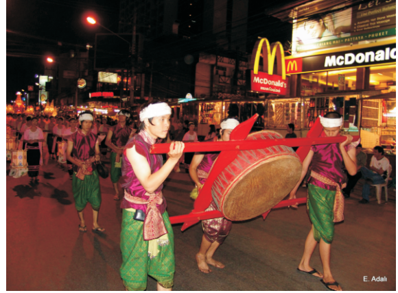
Loy Krathong Festivali (2008)

Chiang Mai'da Loy Krathong Festivali ile birlikte Yi Peng Festivali'nde kutlanıyor. Yi Peng Festivalinde dilek fenerleri gökyüzüne bırakılıyor. Gökyüzünde çok sayıda feneri bir arada görebiliyorsunuz.