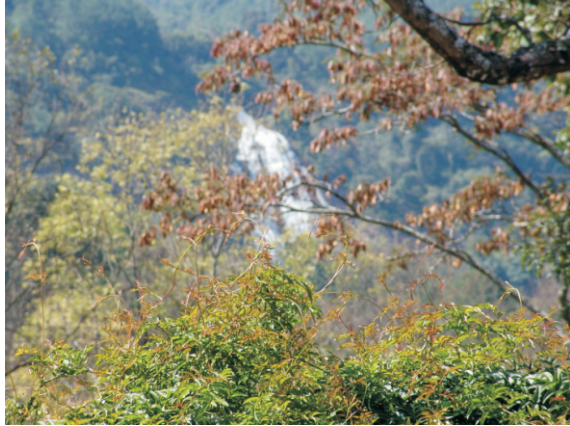
Doi Inthanon Parkı (2008)

Yaklaşık 500-510 kayıtlı kuş türüyle Doi Inthanon, Tayland'daki tüm milli parklar arasında en yüksek kuş çeşitliliğine sahiptir. Tayland'da sadece Doi Inthanon'da kaydedilen bazı kuş türleri arasında kül rengi boğazlı yaprak ötleğenleri, koyu göğüslü gülbüülleri ve yakalı grosbeaklar bulunur. Birçok diğer tür ise sadece Doi Inthanon ve bitişik parklarda bulunur. Kuş göçü faaliyetleri Mart ayı civarında artar ve üreme mevsimi boyunca Haziran veya