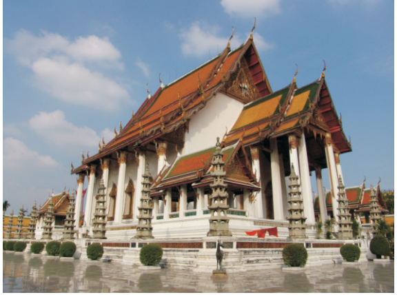
Wat Suthat Thepwararam Tapınağı (2008)

Ubosot'un etrafında, çevreleyen manastır duvarına yerleştirilmiş sekiz adet sınır taşı türbesi (sema) bulunur. Her birinde, her hortumunda kapalı bir lotus tomurcuğu tutan ve üstünde üç açık lotus çiçeği bulunan üç başlı filin oyulmuş olduğu bir çift gri mermer sınır taşı vardır. Manastır duvarının kuzey ve güney taraflarında, devlet törenleri sırasında halka sadaka dağıtmak için kullanılan kraliyet platformları olarak kullanılan dört adet yükseltilmiş köşk bulunur; bunlar "koi proi than" veya sadaka dağıtma köşkları olarak bilinir.