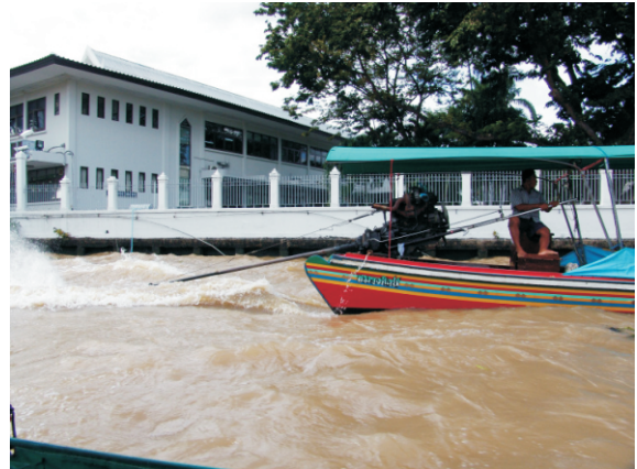
Uzun kuyruklu tekne (2008)

Uzun kuyruklu adı verilen tekneler, en çok 10-15 kişiyi taşıyabilecek teknelerdir. Bu boyuttaki tekneler için çok güçlü motor de gerekmez ve motor teknenin ortası ile arkası arasında gövdeye yerleştirilir. Bu anlattıklarım, uzun kuyruklu tekneler için geçerli değildir. Uzun kuyruklu teknelerde genellikle eski arabalardan sökme 100 beygir ya da daha güçlü motorlar kullanılıyor. Motorun kuyruk çıkışına neredeyse teknenin boyu kadar uzun bir mil bağlanıyor ve milin ucunda pervane bulunuyor. Motor gövdeye sabitlenmiyor, gövdesinin ortasından tekneye bir mafsalla bağlanıyor. Böylece dümen gerektirmiyor. Kaptan motoru sağa-sola, aşağı-yukarı hareket ettirebiliyor. Sağ sol hareketler ile tekneye yön verilebiliyor. Aşağı yukarı hareket ile gemi hızlanıp durdurulabiliyor.