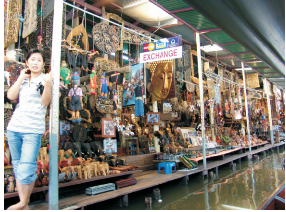
Damnoen Saduak Yüzen Pazarı (2008)

Saduak'a paraleldir ve daha büyük tur gruplarına mal satmak için kanal kıyılarında hediyelik eşya dükkanları bulunmaktadır. Khun Phitak, Hia Kui'nin yaklaşık 2 Km güneyindedir ve en küçük ve en az kalabalık pazardır.