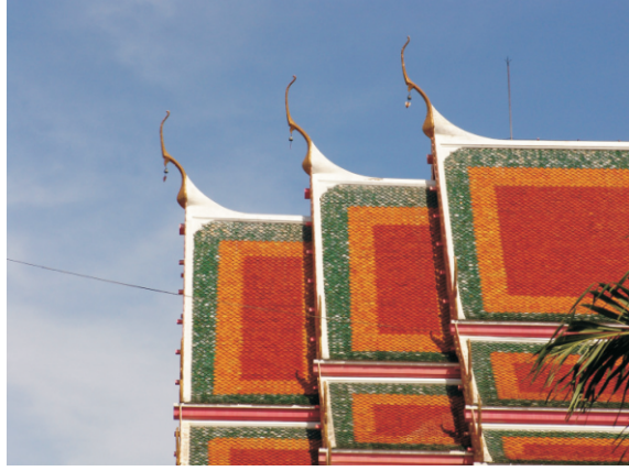
Wat Phlapphla Chai Tapınağı (2008)

Tapınağın bulunduğu yerin bir zamanlar infaz alanı olduğuna inanılmaktadır. Bu sonuca, Kral Chulalongkorn (Rama V) döneminde bölgeden geçen bir yolun yapımı sırasında tapınak çevresinde ortaya çıkarılan çok sayıda insan iskeletinden varılmıştır. Bu yolun diğer sokaklarla kesiştiği yerde oluşan kavşak, Ha Yaek Phlapphla Chai (Tayca sözcük anlamı "Phlapphla Chai beş yollu kavşak") olarak bilinmeye başlandı ve çevredeki mahalle de sonunda Phlapphla Chai olarak anılmaya başlandı.